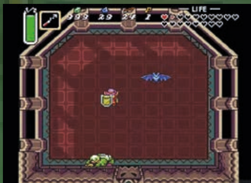
Porážka čaroděje Agahnima

V průběhu hry hlavní postava po dokončení dungeonů osvobozuje jednotlivé kněžky zakleté do krystalů (časem se ukáže že Zelda je jednou ze 7 postav). Link se vydává na Hrad Hyrule, kde po vynaložení značného úsilí osvobozuje princeznu Zeldu a následně je přemístěn do temného světa. Každá lokace napříč hrou obsahuje své charaktery se svými příběhy. Jak bylo zmíněno, hra má otevřený svět a není zde jasně daná dějová linka, spíše se skládá z menších dobrodružství. Po dokončení větší části úkolů se Link vydává do Ganonovy věže kde poráží čaroděje Agahnima. V rámci jeho cutscény se objevuje temný netopýr, který následně odlétá. Závěrečného bosse je možné vyzvat v pyramidě moci (temný svět) a příběh po tomto obtížném souboji končí. Link následně získá Triforce a pomocí něj vymaže temný svět.