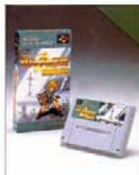
バックリールバックアップ機能付