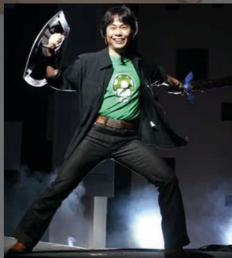
Shigeru Miyamoto, tvůrce série Legend of Zelda

Celkově měla hra velký úspěch. Obecně patří k jednomu z nejprodávanějších titulů konzole Super Nintendo Entertainment Systému vůbec, celkově bylo prodáno 4.61 milionů kopií. V Japonsku se stala nejlépe prodávanou hrou za rok 1991 roku 1992 a v Americe byla třetí nejprodávanější hrou roku 1992, hned po Sonicovi a Street Fighterovi. Na příčkách samotné konzole se také celkově udržela překvapivě vysoko - 5 let po sobě byla na prvním místě. Krom nespočtu prodaných kopií byla The Legend of Zelda: A Link to the Past také oceněna množstvím cen.