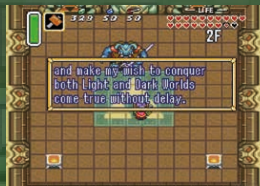
Závěrečný bossfight s Ganonem