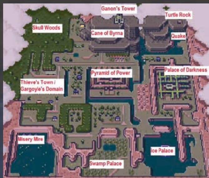
The Dark World mapa