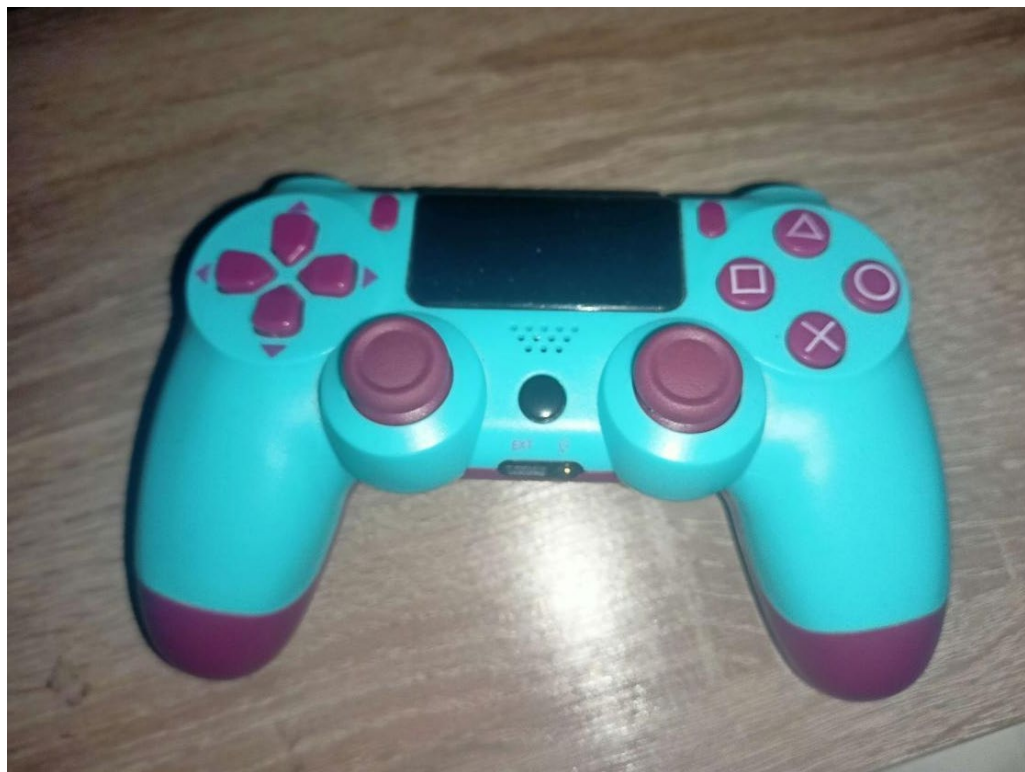
Bootleg indický PS4 ovladač zvaný „Doubleshock“ jež se nachází v mém vlastnictví.